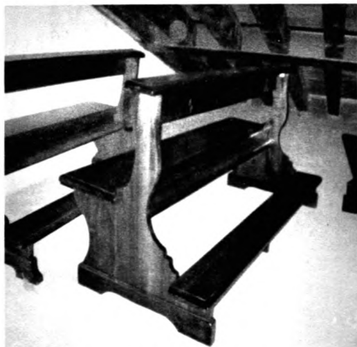
Alcuni esempi di banchi da noi eseguiti

Eseguiamo il recupero, la ricostruzione, il restauro e la produzione di banchi, confessionali, sacrestie, librerie, mobili, infissi, porte e portoni nonché pavimenti, travature e pareti in legno.