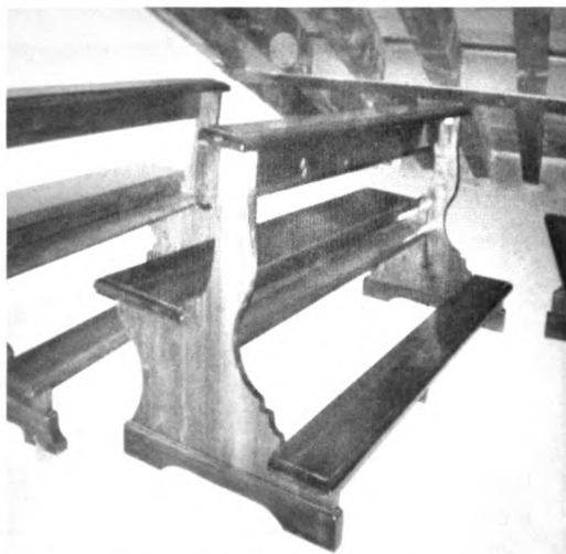
Alcuni esempi di banchi da noi eseguiti

Eseguiamo il recupero, la ricostruzione, il restauro e la produzione di banchi, confessionali, sacrestie, librerie, mobili, infissi, porte e portoni nonché pavimenti, travature e pareti in legno.