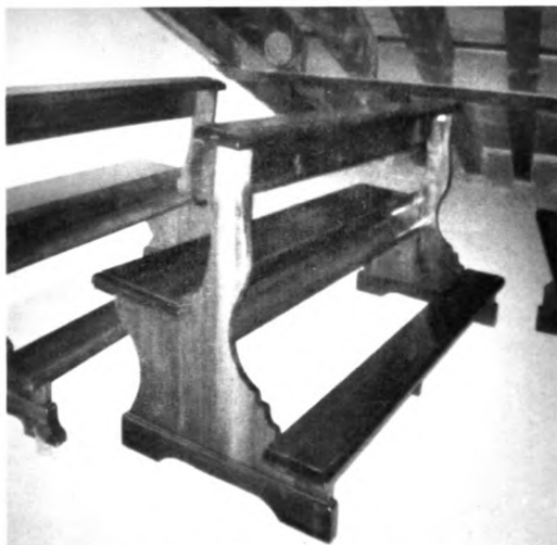
Alcuni esempi di banchi da noi eseguiti

Eseguiamo il recupero, la ricostruzione, il restauro e la produzione di banchi, confessionali, sacrestie, librerie, mobili, infissi, porte e portoni nonché pavimenti, travature e pareti in legno.