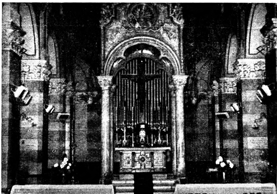
Chiesa di S. Dalmazzo in Torino (Presbitero) Impianto di riscaldamento con Pannelli a gas.

Preventivi Disegni e Sopralluoghi gratuiti