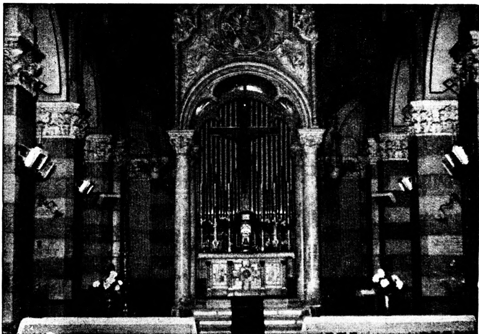
Chiesa di S. Dalmazzo in Torino (Presbitero) Impianto di riscaldamento con Pannelli a gas

Facilitazioni nei pagamenti - Preventivi Disegni e Sopralluoghi gratuiti